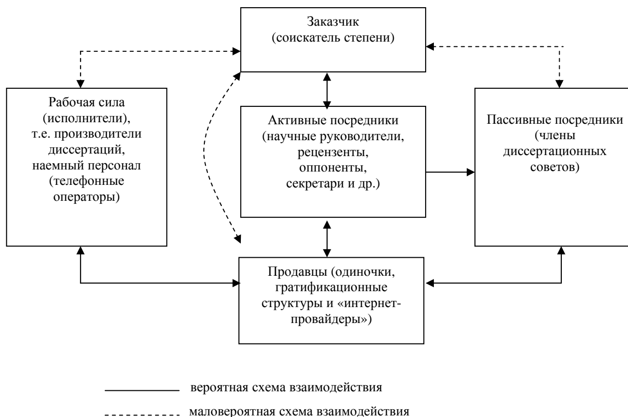
Рисунок 2. Схема взаимодействия на рынке диссертационных услуг.

В рамках второго типа организаций отношения с райтерами диссертаций также поддерживаются на контрактной основе, оговариваются сроки и характер выполнения работ. Наем райтеров осуществляется на рыночной основе. Важным преимуществом данного типа организаций является соблюдение конфиденциальности. В отличие от первого типа, здесь организация может вообще не контактировать с заказчиком напрямую, вся коммуникация может происходить виртуально: начиная с этапа оформления заказа и заканчивая выплатой