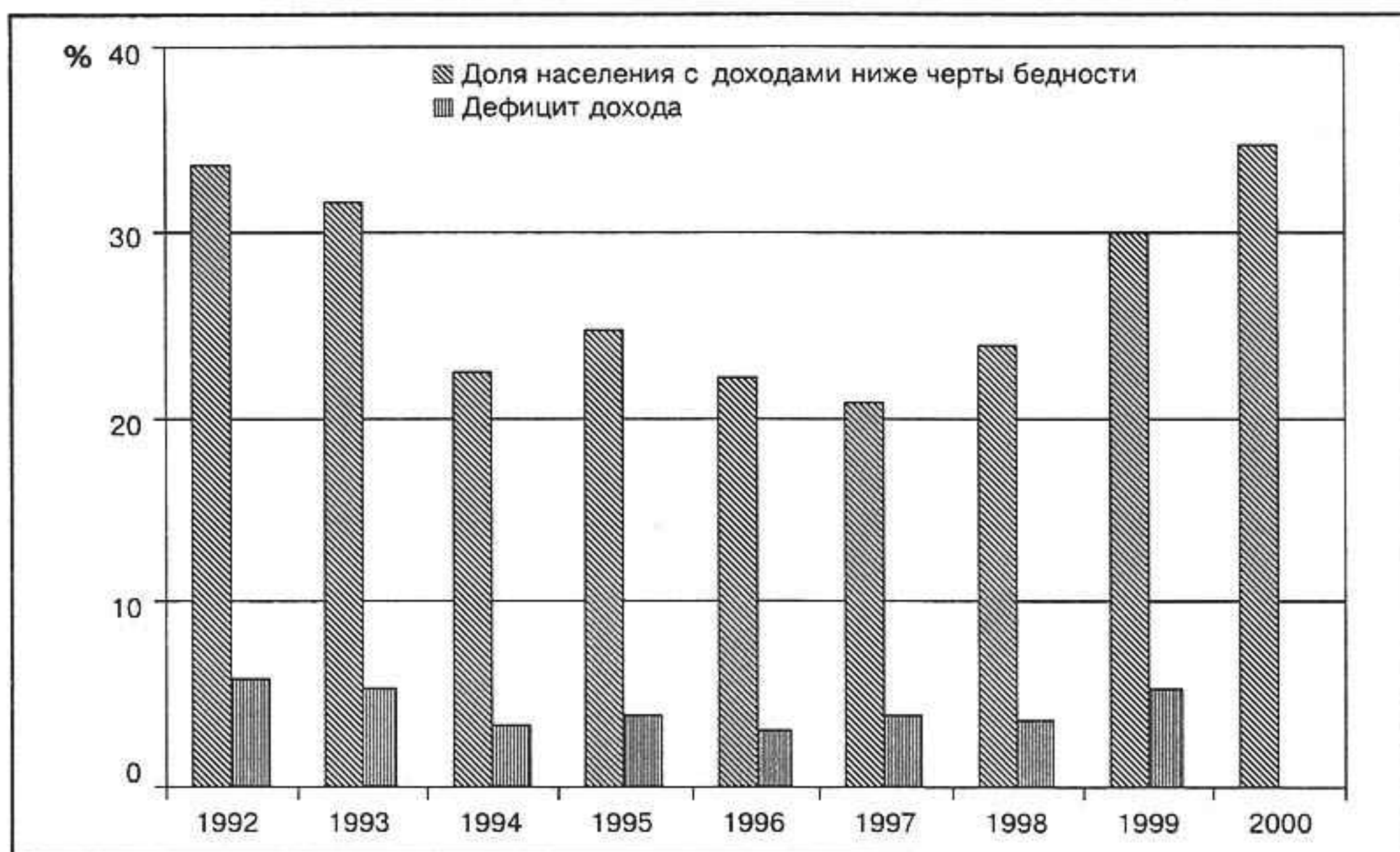
Рисунок 1 Доля бедного населения и величина недостающего дохода. Россия, 1992–2000 гг.

В среднем для всего населения России расходы на питание составляли в ней 68,3 % всех расходов семьи; на непродовольственные товары – 19,1 %; на услуги – 7,4 %; на налоги и платежи – 5,2 %.