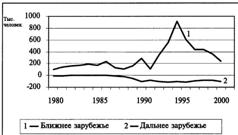
Рис.2 Россия в миграционном обмене со странами ближнего и дальнего зарубежья. Чистая миграция, 1980-2000 гг., в тыс. человек

Сейчас большинство иммигрантов — русскоязычные, среди них преобладают русские и представители других народов России. Главной причиной их иммиграции (репатриации) в Россию служат трудности адаптации к новым социально-политическим и экономическим реалиям в странах, где они оказались после распада СССР. Отсутствие языковых и культурно-бытовых проблем, общность менталитета, образования и другие факторы облегчают их адаптацию к российским условиям. Репатриация российских соотечественников из новых независимых государств стала важнейшей компонентой миграционных процессов России в 1990-х годах.