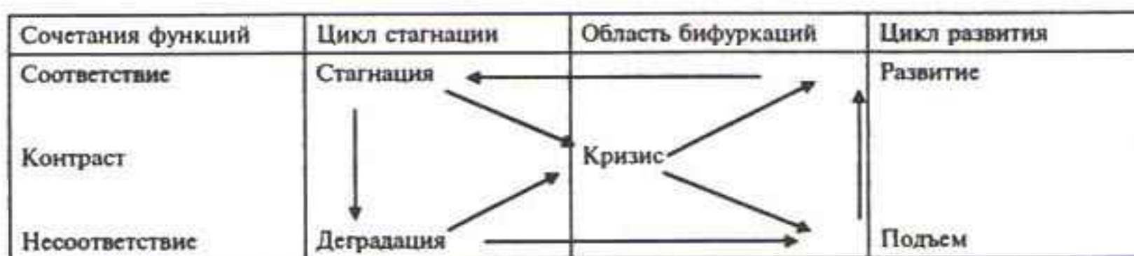
Рис. 2 Взаимосвязь двух циклов эволюции социальных функций регионов

Средний уровень развития региона оказывается принципиально амбивалентным в эволюции соотношения его социальных функций. Для него характерно несоответствие функций друг другу; оно указывает на существование дисбаланса, который чреват двумя возможностями: с одной стороны, кризисными контрастами с последующей деградацией, а с другой — посткризисным подъемом и дальнейшим развитием. Реализация той или иной возможности во многом зависит от действий органов управления и иных, в том числе спонтанных акторов — индивидов, социальных групп и организаций, массовых движений, обладающих сильными ресурсами.