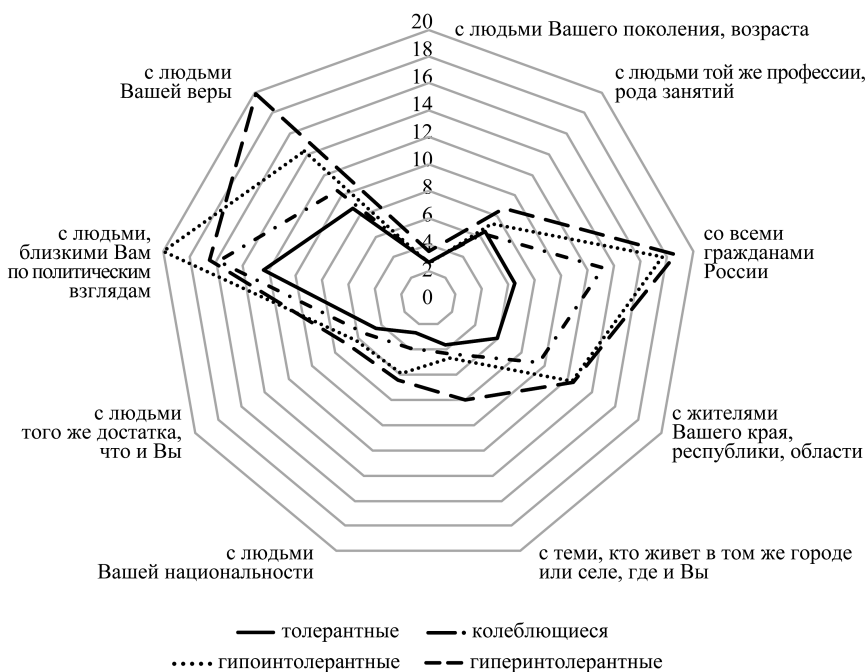
Рисунок 3. Отрицание идентичности респондентами с разными установками толерантности (распределение ответов на вопрос «Как часто Вы ощущаете близость, единство с перечисленными ниже людьми, о ком Вы могли бы сказать “это мы”?»), % опрошенных, ответившие «никогда»