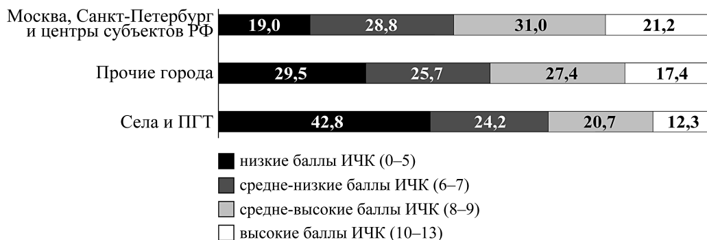
Рисунок 2. Значения ИЧК у профессионалов, проживающих в разных типах поселений, 2019 г., %

значениями ИЧК таких было 68,8%. Повышает, хотя и в меньшей степени, относительно низкое качество человеческого капитала во всех типах поселений и риски малообеспеченности.