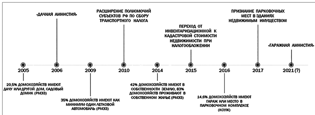
Рисунок 2. Хронология налоговых новаций государства в привязке к уровню обеспеченности российских домохозяйств активами, связанными с соответствующими налоговыми мерами (наше время)